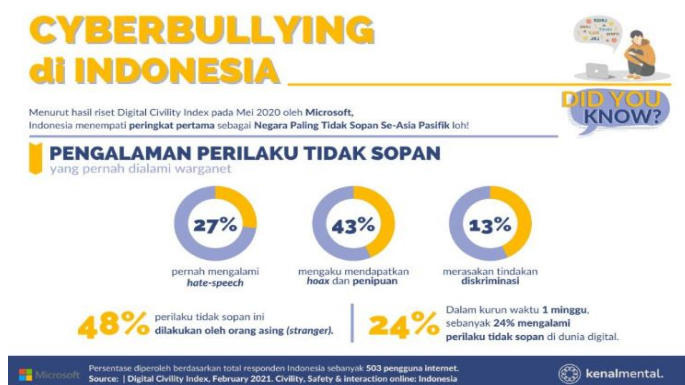
Gambar 2. Riset Microsoft tentang Cyberbullying di Indonesia [13]

Cyberbullying adalah merupakan salah satu tindakan perundungan kepada pengguna media sosial atau perangkat elektronik baik itu individu, kelompok, atau golongan. Tindakan Cyberbullying sendiri bisa berupa penghasutan, pengancaman, mengucilkan, menyuruh anak-anak mengirimkan gambar atau video yang bermuatan unsur pornografi dan lainnya. Menurut penelitian yang dilakukan oleh Microsoft, pengalaman perilaku tidak sopan yang dialami oleh pengguna sosial media juga tidak dapat dianggap enteng. Seperti terlihat pada Gambar 1, terlihat sebanyak 27% responden pernah menjadi korban ujaran kebencian, 43% responden mendapatkan berita bohong, dan 13% responden pernah merasakan tindakan diskriminasi [13].